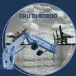
GRU DI BORDO