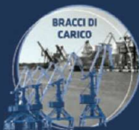
BRACCI DI CARICO